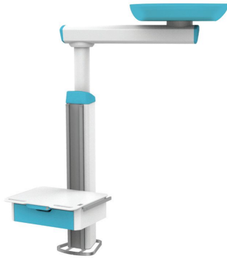
Configuração mono, braço único, caixa vertical