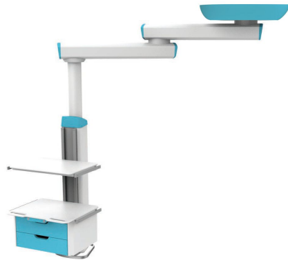
Configuração mono, braço duplo, caixa vertical