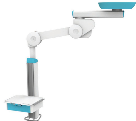
Configuração mono, braço motorizado duplo, caixa vertical