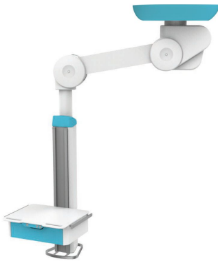
Configuração mono, braço motorizado único, caixa vertical